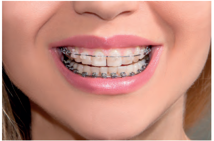
Promesse d'un nouveau sourire, les appareils d'orthodontie pour adultes se font plus discrets.

Lorsque le blanchiment ne suffit pas ou lorsque s'ajoutent aux problèmes de couleur, des anomalies de positionnement ou de forme des dents, le réalignement dentaire et les facettes peuvent donner des résultats exceptionnels. Mais le prix est élevé.