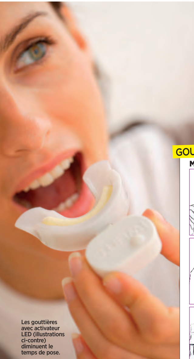
Les gouttières avec activateur LED (illustrations ci-contre) diminuent le temps de pose.